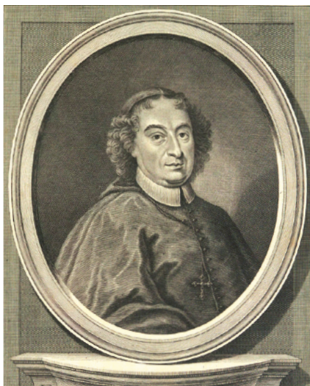
Итальянский кардинал Августино Кузани (Augustinus Cusanus) (1542–1598)