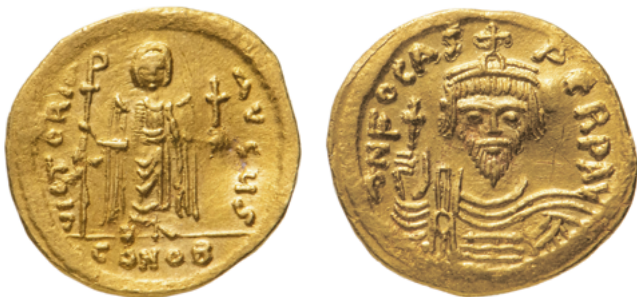
Солид императора Фоки (лат. Flavius Phocas Augustus)