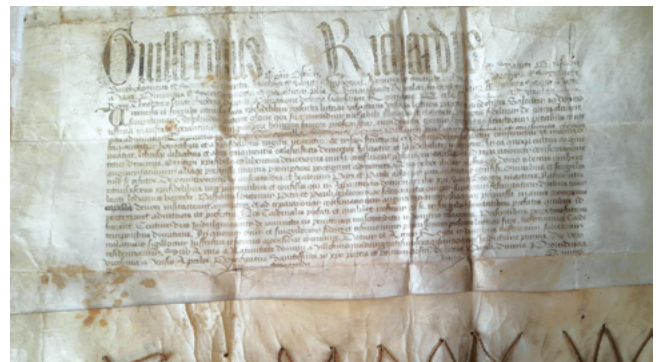
Грамота, подтверждающая отпущение грехов на 100 дней. Рим, 20 апреля 1468 г. Пергамен 52 x 41 см. Собрание Гродненского государственного историко-археологического музея.