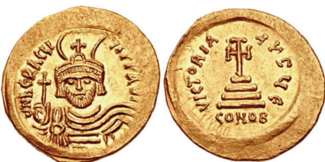
Солид императора Ираклия I (лат. Flavius Heraclius Augustus)