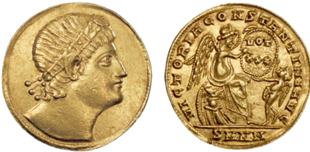
Солид императора Константина I Великого (лат. Flavius Valerius Constantinus ), посвященный 30-летию его правления. Монетный двор Никомедия.

В 1586 г. при разборе фундамента Латеранской базилики (базилики Святого Иоанна Крестителя) в Риме был найден клад из 125 поздних римских и византийских солидов. Эта базилика является старейшей и старшей по рангу из 4 великих патриарших базилик вечного города. Ее строительство было начато в октябре 312 г., еще до легализации христианства Миланским эдиктом, и завершено в 318 г. [11, с. 1517]. Базилика несколько раз восстанавливалась после войн и стихийных бедствий [11, с. 1518]. В 1586 г. на месте старого Латерана была возведена новая летняя папская резиденция по проекту архитектора Доменико Фонтана (1543–1607), тогда и были обнаружены монеты. Хронологические рамки латеранского клада – от императора Феодосия I Великого (379–395) до императора Восточной Римской империи Ираклия I (610–641). На аверсе монет представлены портреты правителей-христиан. На реверсе – крупным планом крест на Голгофе или небольшие изображения символа государственной религии – креста как детали оформления композиции оборота солида [14, р. 788].