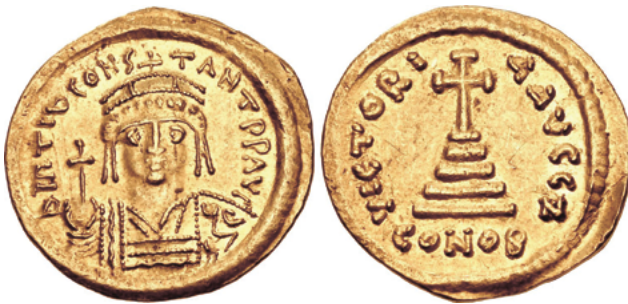
Солид императора Тиберия II Константина (лат. Flavius Tiberius Constantinus)