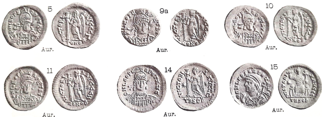
Солиды императора Льва I (лат. Flavius Valerius Leo)