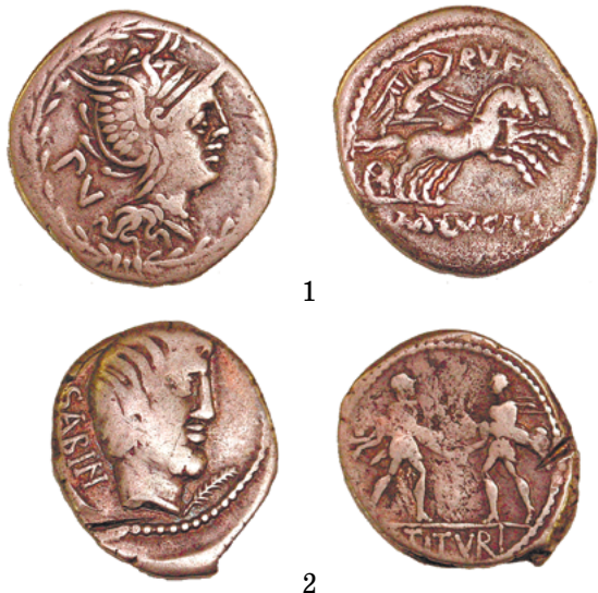
Дэнарыі Рымскай Рэспублікі (са збору Нацыянальнага гістарычнага музея Рэспублікі Беларусь)