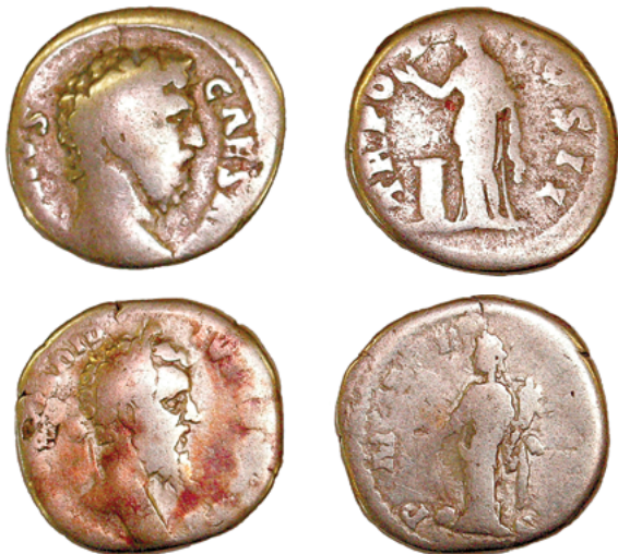
Дэнарыі Рымскай Імперыі (са скарбу з-пад в. Малеч Бярозаўскага раёна Брэсцкай вобласці; Нацыянальны гістарычны музей Рэспублікі Беларусь)

Такім чынам, ёсць значныя падставы меркаваць, што насельніцтва вельбарскай культуры з'яўлялася асноўным (нават дамінуючым) пастаўшчыком рымскіх манет на тэрыторыю Беларусі. Але гэтыя датычыцца срэбных дэнарыяў (малюнак 4) і, верагодна, рымскага манетнага золата. Медныя манеты Рымскай Імперыі (перадусім, буйныя наміналы II ст. – сярэдзіны III ст.) паступалі на нашы землі іншымі шляхамі. Памеры гэтых паступленняў, у параўнанні са срэбрам, былі даволі сціплымі, але іх нельга назваць выпадковымі. Звязаны яны, перадусім, са складанымі этнасацыяльнымі працэсамі, якія адбываліся ў эпоху рымскіх уплываў.