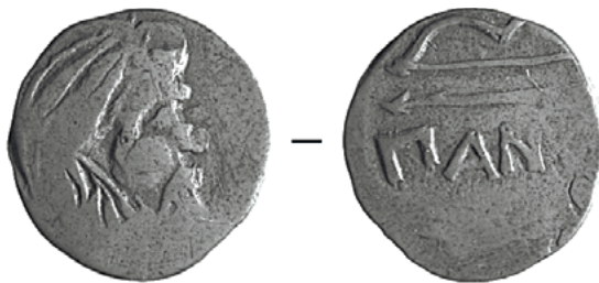
Тэтрахалк Панцікапея (220–210 гг. да н. э.) з г. Пінска Брэсцкай вобласці (Нацыянальны гістарычны музей Рэспублікі Беларусь) Малюнак 2