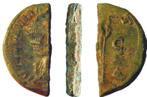
Адсечаны фрагмент сестэрцыя Юліі Мамзі (222–235 гг.) з-пад в. Сянькоўшчына Слонімскага раёна Гродзенскай вобласці (прыватная калекцыя)

Цалкам верагодна, што сыравінная функцыя не была адзінай для медных рымскіх манет. Магчыма, яны маглі выкарыстоўвацца і ў гандлёвых аперацыях