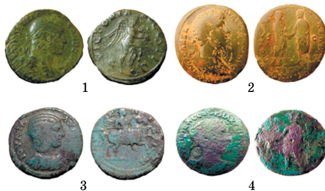
Медныя манеты Рымскай Імперыі з Віцебскай вобласці: 1 – сестэрцыі Аляксандра Сэвэра (в. Гута, Ушацкі раён); 2 – сестэрцыі Люцыя Вера (бераг воз. Недрава, Браслаўскі раён); 3 – манета Юліі Домны (в. Копцевічы, Чашніцкі раён); 4 – манета Макрына (в. Юзафова, Глыбоцкі раён). 1–2 – Рым; 3–4 – Нікея (Віфінія)

На поўначы і ўсходзе Беларусі таксама назіраецца адносна вялікая колькасць медных наміналаў Рымскай Імперыі. Але ў параўнанні з заходнімі абласцямі нашай краіны сярод рымскай медзі тут значную частку складаюць эмісіі ўсходніх правінцый Імперыі (малюнак 5: 3–4), перадусім балканскіх і дунайскіх. Гэта датычыцца, у першую чаргу, Падняпроўя, з якога паходзіць каля паловы падобных знаходак у Беларусі [37]. У той жа час тут рэгулярна сустракаецца і медзь сталічнай чаканкі (малюнак 5: 1–2), і срэбныя дэнарыі. Своеасабліваць у складзе знаходак рымскіх