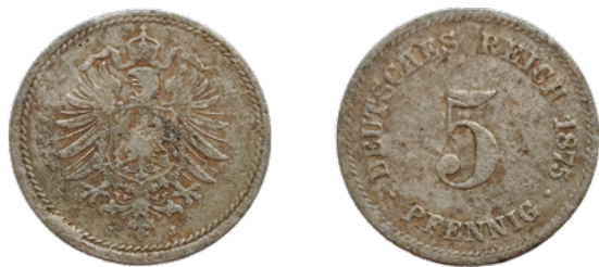
Монета 5 пфеннигов 1875 г. Германская империя. Гамбургский монетный двор. Вильгельм I