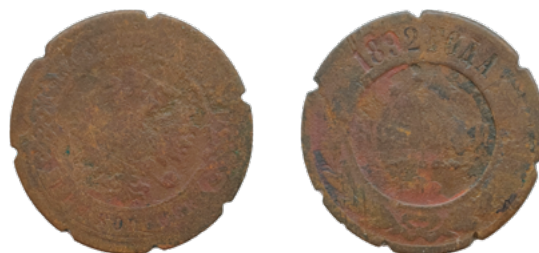
Монета 3 копейки 1892 г. Российская империя. Санкт-Петербургский монетный двор. Александр III