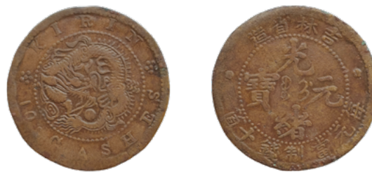
Монета 10 кэш (10 вэней). Между 1889–1908 гг. Империя Цин, монетный двор провинции Гирич

3 и 5 копеек. Единственная монета достоинством 1 копейка сильно затерта, предположительно относится к чеканке 1850-х гг., и монетный двор не определяется. Самая ранняя из двухкопеечных монет также имеет слабую сохранность, в результате чего определить монетный двор не представляется возможным, но по остаткам цифр можно предположить, что она была выпущена в 1858(?) г. Двухкопеечные монеты 1864, 1869, 1872, 1875 гг. выпуска отчеканены в Екатеринбурге; 1876, 1878, 1879, 1881 гг. – в Санкт-Петербурге. Все они представлены в кладе в единичном экземпляре. Трехкопеечные монеты представлены теми же монетными дворами: к чеканке Екатеринбургского относятся экземпляры 1872 (1), 1873 (1), 1874 (1), 1875 (4) гг. выпуска, а к чеканке Санкт-Петербургского – 1877 (2), 1878 (1), 1879 (3), 1880 (2), 1881 (4) гг. выпуска. Три копейки 1868 г. затерты, и монетный двор не читается. Среди пятикопеечных монет к чеканке Екатеринбурга относятся монеты 1869 (1), 1870 (2), 1872 (3), 1873 (3), 1875 (3) гг., Санкт-Петербурга – 1877 (1), 1878 (1), 1879 (1), 1881 (3) гг.