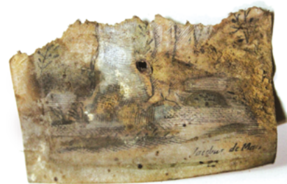
Фрагмент абразка на пергаменце

Каля левага пляча быў знойдзены малы шкаплер, а каля правай рукі – фрагменты скуранага пояса з надпісам на польскай мове: «... PODCZIE DO MNIE WSZY... W UTRAPIENIACH ZOSTANIECIE JA WAS POC... » (малюнак 16). Магчыма, гэты надпіс з Евангелля ад Мацвея (11-я глава, 28-ы верш): «Прыйдзіце да Мяне, усе спрацаваныя і абцяжараныя, і Я супакою вас». Таксама быў знойдзены фрагмент абразка на пергаменце з выявамі ствала дрэва, босых ног і надпісам: « Jacobus de Ma... » (лакаў з Маркі) (малюнак 17). Даследчыкі лічаць, што гэта манах-францысканец, які жыў у XV ст. Таксама яны адзначылі, што Францішка Уршуля мае прамое дачыненне да дамініканцаў і бернардынцаў. Яе зводная сястра была ігуменнай жаноча-