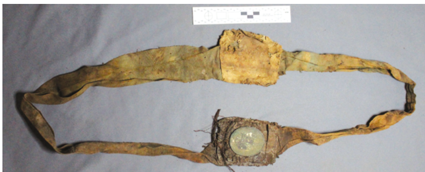
Шкаплер канца XVIII ст.

[8, с. 142]. Гэтую выяву вельмі часта звязваюць з хрысціянскім святам Успення Прасвятой Багародзіцы, прысвечаным узнясенню Марыі на неба пасля смерці. Надпіс вакол выявы першапачаткова бярэ свае карані з Евангелля ад Лукі (1-я глава, 28-ы верш): « Ave, gratia plena, Dominus tecum » (Радуйся, поўная благадаці, Гасподзь з табою).