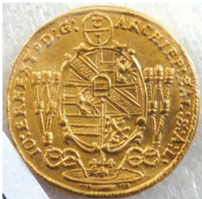
Манета, ½ дуката, архібіскупства Зальцбург, 1690 г. (аверс, рэверс)