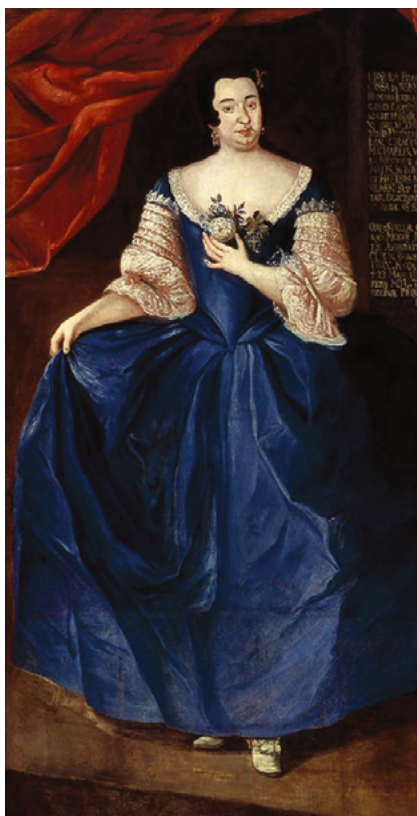
Францішка Уршуля Радзівіл (1705–1753)