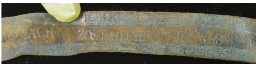
Фрагменты скуранага пояса з надпісам