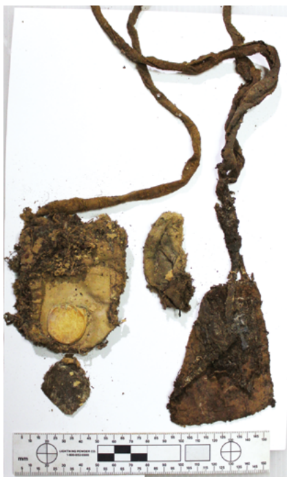
Шкаплер сярэдзіны XVIII ст.

Шкаплер трапіў у музей дзякуючы праведзеным даследаванням у 2016–2017 гг. у крыпце нясвіжскага касцёла Божага Цела ў рамках літоўска-беларускага праекта «Даследаванні і канцэпцыя прыстасавання да наведвання пахавальні княжацкага роду Радзівілаў у крыпце нясвіжскага касцёла». Галоўная мэта – комплекснае даследаванне крыпты, якое ўключала вывучэнне саркафагаў, антрапалагічных рэшткаў і пахавальных рэчаў, а таксама самой крыпты [2, с. 216]. Была створана спецыяльная камісія, у якую ўваходзілі літоўскія і беларускія даследчыкі (гісторыкі, антрапалагі, рэстаўратары).