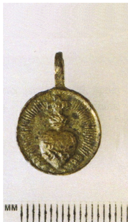
Латунны двухбаковы медальён

На шкаплеры канца XVIII ст. (малюнак 10) – металічны двухбаковы медальён з выявай Дзевы Марыі і Ісуса Хрыста з аднаго боку і знакам Святой Троіцы з другога боку (малюнак 11).