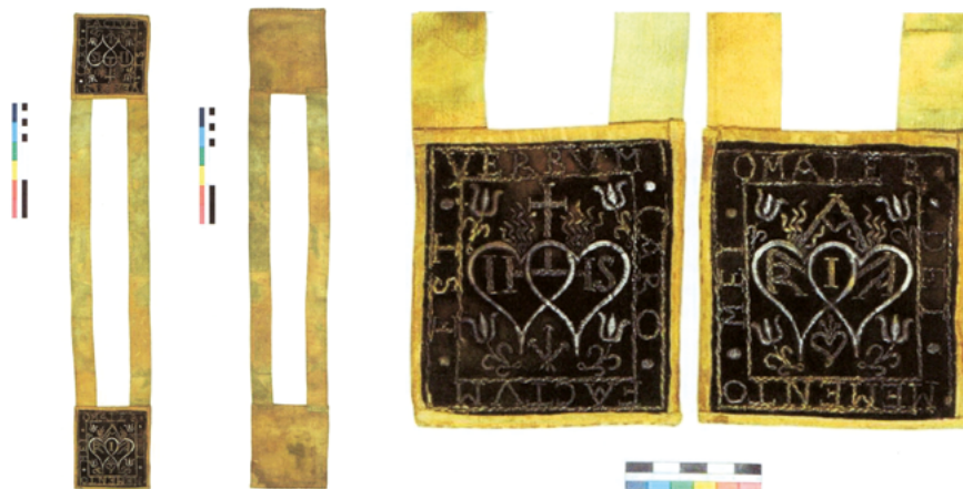
Шкаплер пачатку XVIII ст. (пасля рэстаўрацыі)