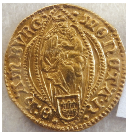
Манета, дукат г. Гамбурга, 1662 г. (аверс, рэверс)