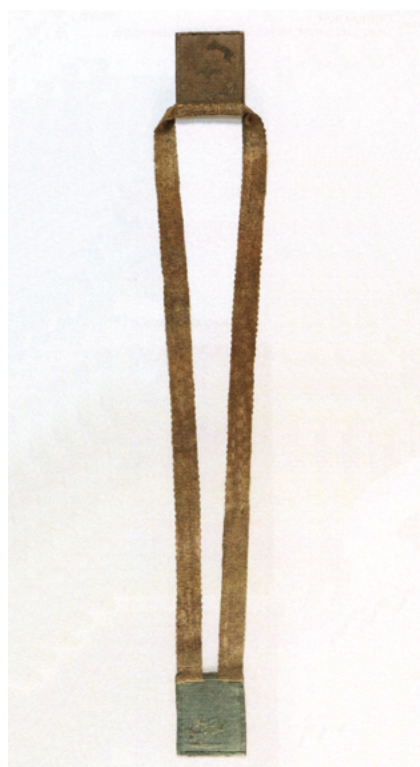
Шкаплер сярэдзіны XVIII ст. (пасля рэстаўрацыі)