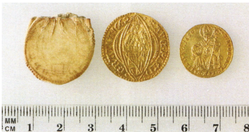
Манеты пасля кансервацыі