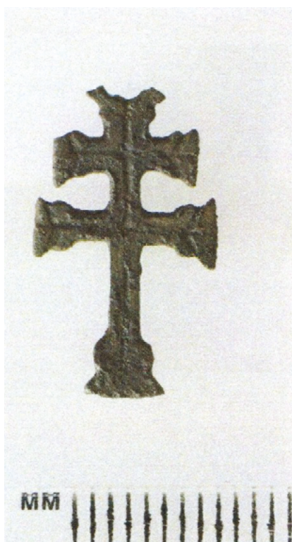
Срэбны латарынгскі шасціканцовы крыжык