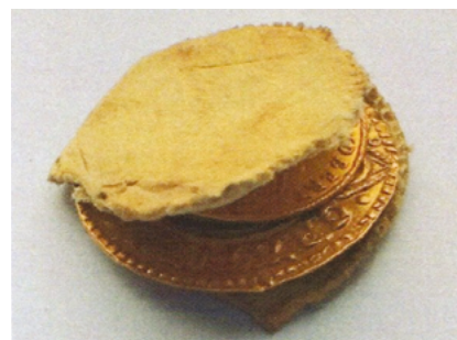
Манеты, знойдзеныя падчас рэстаўрацыі шкаплера