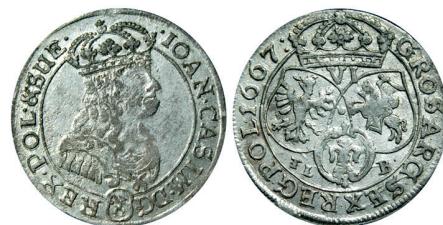
Рисунок 21. Шостак № 11 1667 г., монетный двор «Краков»

Монеты имеют те же отличительные черты – своеобразная Погоня, цветок между гербами, буква U в сокращении SUE(ciae) на аверсе. Однако заметно, что они выполнены другим мастером. Цифра 7 в дате отличается от рисунка 5, она похожа на используемую на штемпелях Быдгощской менницы, крупные буквы TLB и др. По всей видимости этот резчик переехал из Быдгоща, потому что известны шостаки «смешанного» типа, на которых имеется только один из двух главных отличительных признаков – либо буква U, либо цветок (рисунки 21, 22). Причем аверс монеты на рисунке 22 совпадает с аверсом Быдгощского шостака на рисунке 12 (с буквой V в сокращении SVE(ciae), а реверс экземпляра на рисунке 21 похож на реверс всех вышеперечисленных монет Быдгощской чеканки (такая же Погоня и Орел). Можно предположить, что при его изготовлении использовались отдельные пуансоны из «Быдгощского набора», привезенного с собой резчиком. Косвенным фактом работы одного и того же резчика может также служить написание сокращения в легенде аверса на некоторых монетах Быдгоща (рисунком 12) и Кракова (рисунком 19), изображенное на рисунке 23.