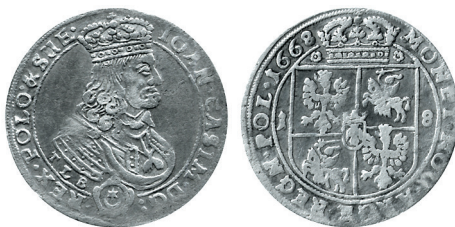
Рисунок 25. Орт № 2 1668 г., монетный двор «Краков»