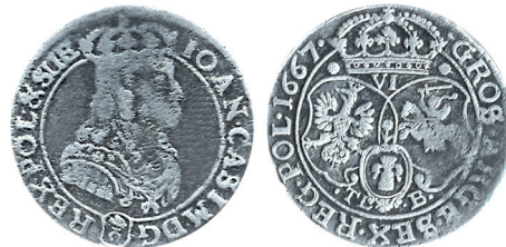
Рисунок 20. Шостак № 10 1667 г., монетный двор «Краков»

Монеты имеют те же отличительные черты – своеобразная Погоня, цветок между гербами, буква U в сокращении SUE(ciae) на аверсе. Однако заметно, что они выполнены другим мастером. Цифра 7 в дате отличается от рисунка 5, она похожа на используемую на штемпелях Быдгощской менницы, крупные буквы TLB и др. По всей видимости этот резчик переехал из Быдгоща, потому что известны шостаки «смешанного» типа, на которых имеется только один из двух главных отличительных признаков – либо буква U, либо цветок (рисунки 21, 22). Причем аверс монеты на рисунке 22 совпадает с аверсом Быдгощского шостака на рисунке 12 (с буквой V в сокращении SVE(ciae), а реверс экземпляра на рисунке 21 похож на реверс всех вышеперечисленных монет Быдгощской чеканки (такая же Погоня и Орел). Можно предположить, что при его изготовлении использовались отдельные пуансоны из «Быдгощского набора», привезенного с собой резчиком. Косвенным фактом работы одного и того же резчика может также служить написание сокращения в легенде аверса на некоторых монетах Быдгоща (рисунком 12) и Кракова (рисунком 19), изображенное на рисунке 23.