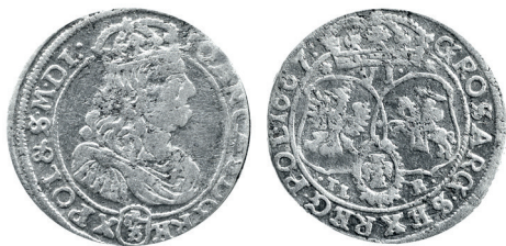
Рисунок 7. Шостак № 2 1667 г., монетный двор «Быдгощ»

Затем в рисунках на монетах произошли существенные изменения: совсем другие изображения короля и формы гербов в отличие от предыдущих ( рисунки 7, 8 ). Обратим внимание на сокращение в легенде аверса (IOAN ... POL & S M D L) и характерное изображение Орла и Погони на первой монете. Они аналогичны экземпляру Быдгоцкого монетного двора ( рисунки 1, 3 ). На втором шостаке также имеется характерное сокращение в легенде аверса (IO... SV M D L), своеобразная форма цифры 7 в дате, как на рисунке 5 , а также схожие рисунки Орла и Погони ( рисунок 4 ). Все вышесказанное позволяет отнести первую монетку к Быдгоцкому монетному двору, а вторую – к Краковскому.