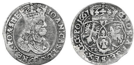
Рисунок 15. Шостак № 5 1667 г., монетный двор «Краков»