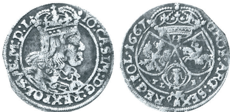
Рисунок 6. Шостак № 2 1667 г., монетный двор «Краков»

С учетом отмеченного выше, шостак, приведенный на рисунке 6 , можно сразу же отнести к Кракову, так как он отличается от шостака на рисунке 2 только наличием букв TLB (Tito Livio Burattini) вместо AT (Andreas Tumpfe) на реверсе.