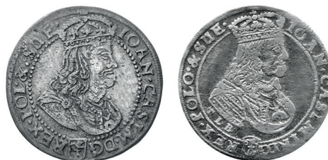
Рисунок 27. Сравнение аверсов шостаков (1) и ортов (2) Краковской чеканки 1668 г.

Изображение Погони на шостаках и ортах, характерное для Краковской и Быдгощской чеканок, тоже однотипное, что также подтверждает правильность сделанных выводов (рисунки 29, 30).