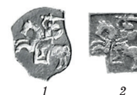
Рисунок 30. Сравнение Погони шостаков (1) и ортов (2) Быдгоща

Таким образом, разделить чеканку ортов в 1667–1668 гг. на Краковскую и Быдгощскую можно по следующим признакам: