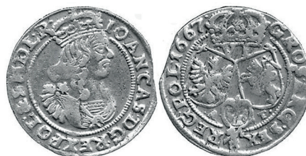
Рисунок 1. Шостак № 1 1667 г., монетный двор «Быдгощ»

Итак, отправными точками послужат шостаки 1667 г. чеканки Быдгоща (рисунок 1) и Кракова (рисунок 2) с буквами AT (Andreas Tumpfe), принадлежность которых к указанным менницам не вызывает сомнения.