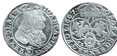
Рисунок 13. Шостак № 7 1667 г., монетный двор «Быдгощ»

Характерной особенностью написания легенды всех Быдгоцких монет данного периода является наличие буквы V в сокращении SVE(ciae) на аверсе.