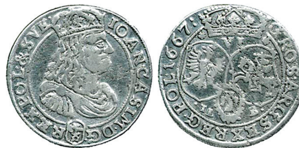
Рисунок 9. Шостак № 3 1667 г., монетный двор «Быдгощ»

отличается от монет 1667 г. на рисунках 7, 9, 10 , то можно сделать вывод, что над изображением короля для экземпляров на рисунках 12, 13 работал другой резчик на второй «производственной линии».