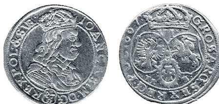
Рисунок 12. Шостак № 6 1667 г., монетный двор «Быдгощ»