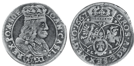
Рисунок 14. Шостак № 4 1667 г., монетный двор «Краков»

На фоне большого количества описанных выше шостаков, которые можно отнести к чеканке Кракова, выделяется особый ряд монет (рисунки 17–20).