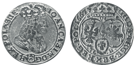
Рисунок 17. Шостак № 7 1667 г., монетный двор «Краков»