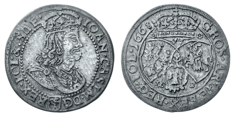
Рисунок 16. Шостак № 6 1668 г., монетный двор «Краков» (WCN)