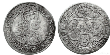
Рисунок 22. Шостак № 12 1667 г., монетный двор «Краков» (WCN)