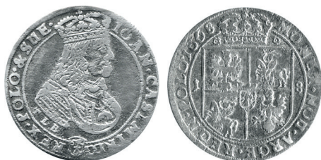
Рисунок 24. Орт № 1 1668 г., монетный двор «Краков»

Также по наличию букв U в сокращениях легенды на аверсе и реверсе можно отнести орты 1668 г. к чеканке Кракова (рисунки 24 и 25), а по присутствию букв V – к чеканке Быдгоща в 1667–1668 гг. (рисунок 26). Отмечу также сходство портретов короля на ортах и шостаках 1667–1668 гг. чеканки этих городов, для чего достаточно сравнить монеты на рисунках 16, 24, 25, а также на рисунках 10, 11, 26 (см. пример на рисунках 27, 28 соответственно).