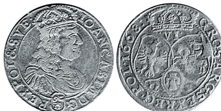
Рисунок 11. Шостак № 5 1668 г., монетный двор «Быдгощ»