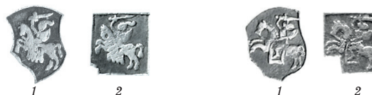
Рисунок 29. Сравнение Погони шостаков (1) и ортов (2) Кракова