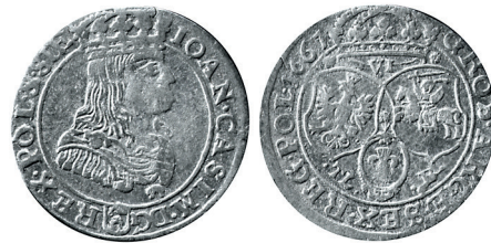
Рисунок 19. Шостак № 9 1667 г., монетный двор «Краков»