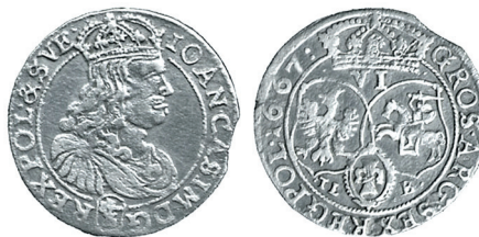
Рисунок 10. Шостак № 4 1667 г., монетный двор «Быдгощ»