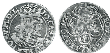
Рисунок 2. Шостак № 1 1667 г., монетный двор «Краков»

Как видим, монеты имеют характерные отличия в портретах короля, изображениях гербов, сокращениях в легендах аверса и написании некоторых букв и цифр. В данном случае в легенде аверса Быдгощского шостака присутствует слово IOAN, а в легенде Краковского – IO. Хорошо отличимы изображения Орла и Погони (рисунки 3, 4), а также написание цифры 7 в дате на реверсе (рисунок 5). Отмечу характерную «зубчатую» форму попоны у всадника на Краковской Погоне и «прямую» – на