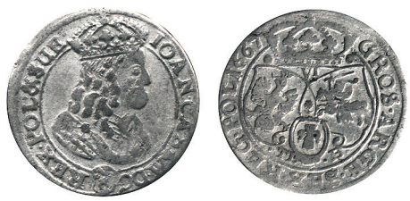
Рисунок 18. Шостак № 8 1667 г., монетный двор «Краков»