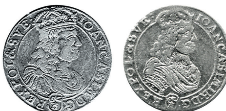
Рисунок 28. Сравнение аверсов шостаков (1) и ортов (2) Быдгощской чеканки 1668 г.