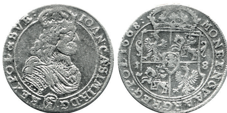
Рисунок 26. Орт 1668 г., монетный двор «Быдгощ»

Изображение Погони на шостаках и ортах, характерное для Краковской и Быдгощской чеканок, тоже однотипное, что также подтверждает правильность сделанных выводов (рисунки 29, 30).