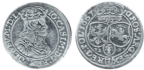
Рисунок 8. Шостак № 3 1667 г., монетный двор «Краков»

Далее, используя указанные отличительные признаки (с учетом появления портрета, как на рисунке 7 ), можно расположить следующий хронологический ряд монет Быдгоцкой менницы ( рисунки 9–13 ). Отмечу некоторые изменения в портретах короля в процессе выпуска монет, особенно у монет на рисунках 12, 13 . С учетом того, что шостак 1668 г. ( рисунок 11 ) по портрету не существенно