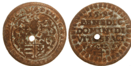
Падскарбуўка Дзмітрыя Халецкага, 1595 г.

Галоўная мэта артыкула – сістэматызацыя інфармацыі аб знаходках лічманаў на тэрыторыі Беларусі, увядзенне яе ва ўжытак. З цягам часу колькасць вядомых лічманаў ВКЛ павялічылася, такім чынам, істотна ўдакладняюцца звесткі,