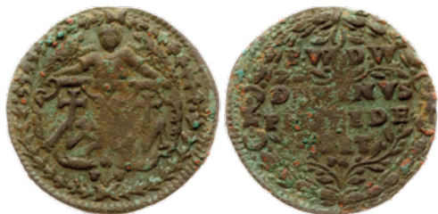
Лічман Пракопа і Даніэля Вяльковічаў, 1584 г.