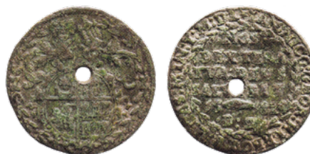
Падскарбуўка Яна Глябовіча (знойдзена каля аг. Беражное Столінскага раёна), 1582 г.

лічмана ўзгадвае Юзаф Ядкоўскі ў сваім артыкуле «Sztabki srebrne z Rybiszek pod Wilnem» [5]. Так, ён піша, што лічман быў адшуканы ў 1930 г. пры будаўніцтве ахоўнага бульвара на Нёмане ад вусця Гараднічанкі ў бок Каложы.