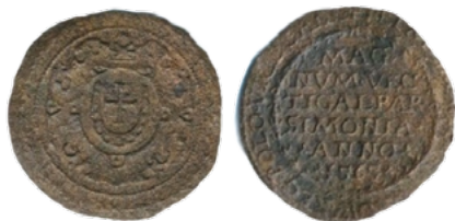
Лічман Пятра Мышкоўскага, 1565 г.