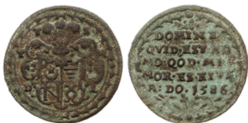
Падскарбуўка Тэадора Скуміна Тышкевіча (знойдзена ў Гродзенскай вобласці), 1586 г.