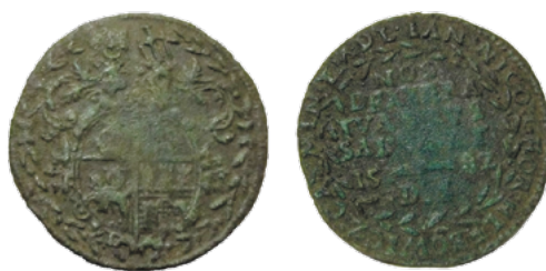
Падскарбуўка Яна Глябовіча (знойдзена каля аг. Ленінскі ў Жабінкаўскім раёне), 1582 г.

быў выяўлены ў 2012 г. каля аг. Беражное Столінскага раёна Брэсцкай вобласці.