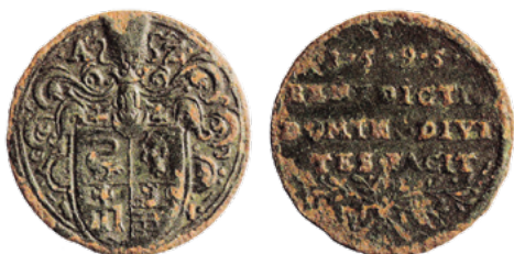
Падскарбуўка Андрэя Завішы, 1595 г.