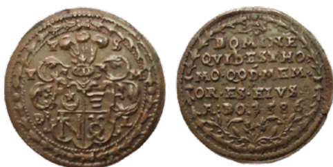
Падскарбуўка Тэадора Скуміна Тышкевіча (знойдзена на Замкавай гары ў Браславе), 1586 г.