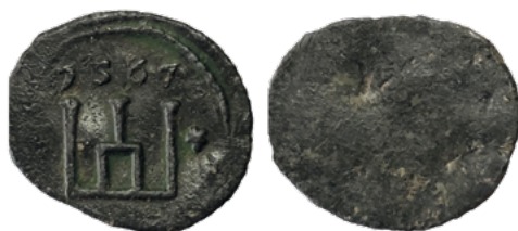
Лічман майстроў мынцы ў Тыкоціне, 1567 г.