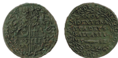
Падскарбуўка Яна Глябовіча (знойдзена каля аг. Дзярэчын Зэльвенскага раёна), 1582 г.