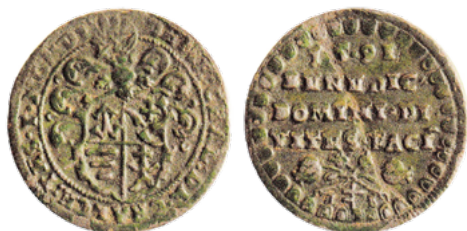
Падскарбуўка Дзмітрыя Халецкага, 1591 г.