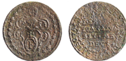
Лічман Яна Абрамовіча, 1581 г.