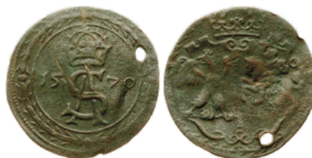
Падскарбуўка Жыгімонта II Аўгуста, 1570 г.