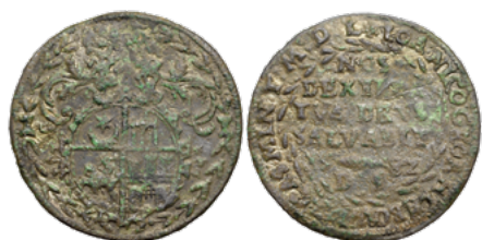
Падскарбуўка Яна Глябовіча (знойдзена ў Мастоўскім раёне), 1582 г.