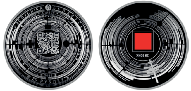
Памятная монета «Вьяўленчае мастацтва. Авангард. УНОВИС» Рисунок 3

Монета «Летнія віды спорту. Баскетбол» имеет сложную геометрию аверса, выполненную в виде вогнутой сферы, в центре которой размещена выпуклая сфера меньшего диаметра, окрашенная тампопечатью. На вогнутой поверхности аверса нанесена проработанная скульптором вручную гравюра, изображающая баскетбольную сетку. Гравюра реверса включает в себя модель баскетболистов и лазерное матирование по зеркальной поверхности.