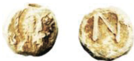
Пломба с изображением св. Василия Кесарийского на аверсе и буквой N на реверсе