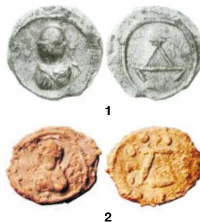
Пломбы с изображением св. князя Бориса на аверсе и буквой Д на реверсе

Источники: [27, рис. 25, с. 331]; [40, фото 3–2].