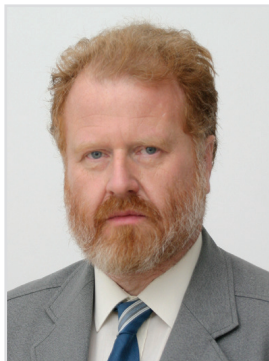
Президент Словацкого нумизматического сообщества при Словацкой академии наук

Использование изображений героических мотивов на монетах имеет давнюю традицию. Она берет свое начало еще в античные времена, когда деньги стали исполнять, кроме своей экономической функции, роль эффективного носителя информации и пропаганды. Значение этих вторичных функций почти исчезло в средневековье, когда уровень гравёрского искусства и технологии чеканки упал до такой степени, что не позволял изображать на монетах четкие рисунки и надписи. Функция носителя информации не только вернулась монетам, но и возросла только в эпоху Ренессанса, особенно это коснулось памятных монет.