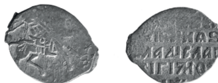
Владислав Жигимонтович, м. дв. Москва, копейка