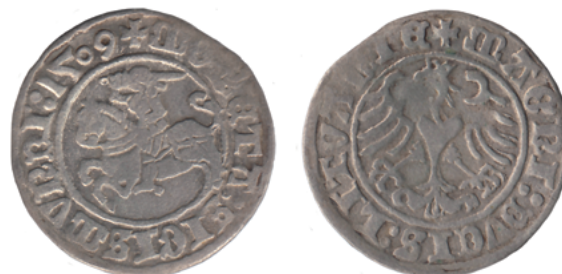
Сигизмунд I Старый, м. дв. Вильно, полугроши 1509 г.

Весной 1950 г. в окрестностях д. Гребень Руденского района (ныне – Пуховичский район) был найден клад. Он поступил в сектор археологии Института истории АН БССР. В 1958 г. научный сотрудник Белорусского государственного музея (сейчас – Национальный исторический музей Республики Беларусь) В.Н. Рябцевич передал находку в фонды музея. Клад хранится под учетным номером КП 791. Согласно акту № 50 от 30 июня 1958 г. было получено 809 монет и фрагменты горшка. В том же акте есть запись, что клад вмещал 851 монету. В настоящее время в состав комплекса входят 817 монет Великого Княжества Литовского, Речи Посполитой, Пруссии, Священной Римской империи и России (рисунок 1). Самыми старыми монетами клада являются литовские полугроши 1509 г. Сигизмунда I Старого (великий князь литовский в 1506–1544 гг.) (рисунок 2). Младшими монетами являются московские копейки времени номинального правления в Русском царстве польского королевича Владислава Жигимонтовича (1610–1612) (рисунок 3).