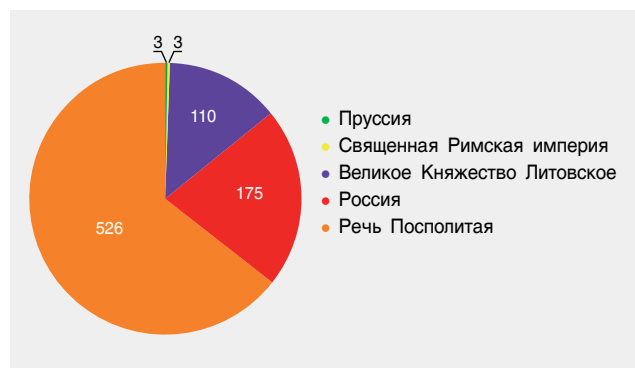
Состав клада по странам

ГУ «Национальный исторический музей Республики Беларусь», научный сотрудник, Республика Беларусь, г. Минск, e-mail: lerakob@yandex.by