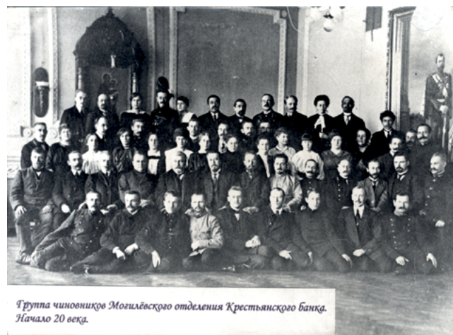
Группа чиновников Могилевского отделения Крестьянского банка. Начало 20 века.