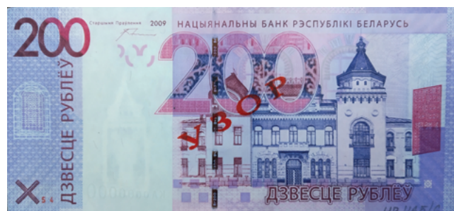
Купюра номиналом 200 рублей образца 2009 г.