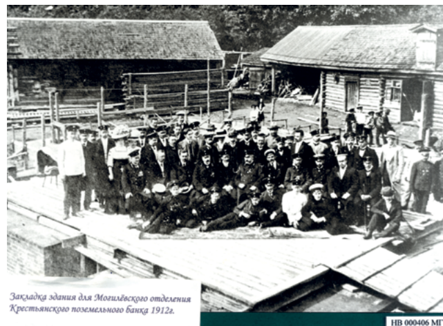
Закладка здания для Могилевского отделения Крестьянского поземельного банка, 1912 г.

КП 1523 ВТ. Договор по ссуде Витебского отделения Крестьянского поземельного банка 4 декабря 1912 г. № 33127 на имя крестьянина Петра Казимира Петровского. Документ извещает, что 23 декабря 1912 г. «назначена ... 19 декабря 1911 г. (процентными бумагами) ссуда № 33127 для покупки 5 дес. 240 саж. земли у землевладельца Георгия Альбертовича Шлиппенбаха в Дриссенском уезде на сумму 270 рублей сроком на 55½ лет». Первый платеж начислен 1 апреля 1913 г. в сумме 4 руб. 64 коп. Последующие платежи по 6 руб. 08 коп. в каждое полугодие.