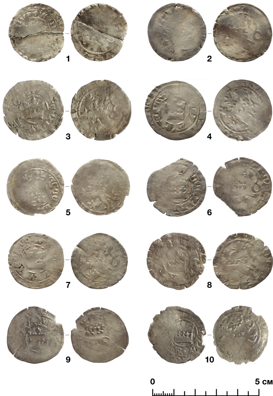
Пражские гроши из состава Недельнинского клада

Помимо русских монет в состав клада входят 10 пражских грошей, отчеканенных в Богемии в правление короля Вацлава IV (1378–1419) на монетном дворе г. Кутна-Гора. По классификации J. Hána, эти денежные знаки разделяются на четыре типа (рисунок 5; таблица 2). Старший экземпляр принадлежит типу V.j/1, выпускавшемуся в 1385–1395 гг. [22, с. 49, 111]. Края монеты