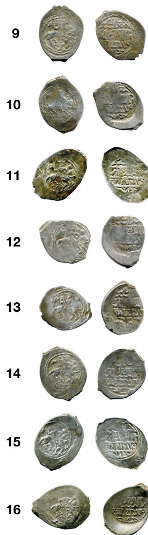
Денги Василия II № 9–16 из состава Недельнинского клада