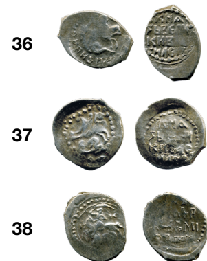
Денги № 36–38 из состава Недельнинского клада: № 36, 37 – Василий II, № 38 – Андрей Дмитриевич Можайский