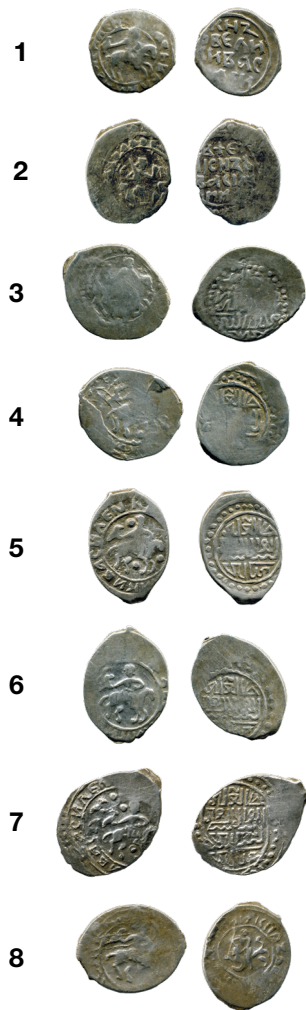
Денги Василия I № 1–8 из состава Недельнинского клада

относится выпуск денги (таблица 1:8, рисунок 1:8) с изображением всадника с соколом и сцены борьбы Самсона со львом [7, № 9]. Эта денга принадлежит большой группе монет с изображением Самсона; их чеканка производилась в Великом княжестве Московском и в его уделах в конце 1410-х – начале второй половины 1420-х гг. Выпуск монет с изображением Самсона, получивший название декларативного чекана, был частью комплекса мероприятий, проводимых Василием I с целью передачи великокняжеского стола своему сыну Василию II в обход других претендентов [20].