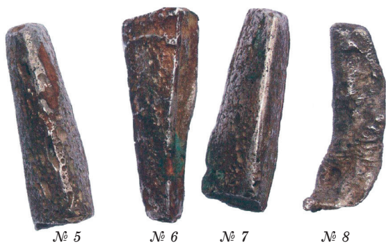
№ 5 № 6 № 7 № 8