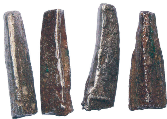
№ 1 № 2 № 3 № 4