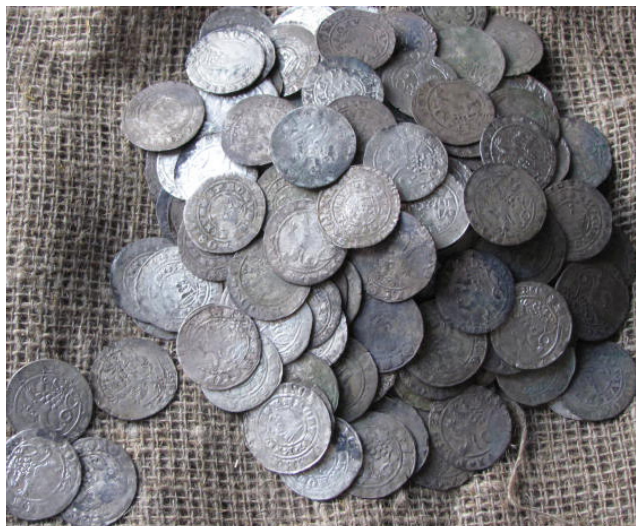
Рисунок 1. Общий вид клада