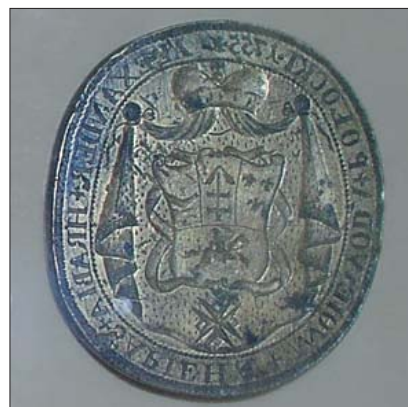
Печать Александра Сапеги — воеводы Полоцкого. 1755 г.

руси и Литве. Однако почувствовав, что деятельность масонов выходит из-под контроля, российские власти потребовали прекращения работы лож. В Российской империи они были закрыты в августе 1822 г., но продолжали действовать в глубоком подполье.