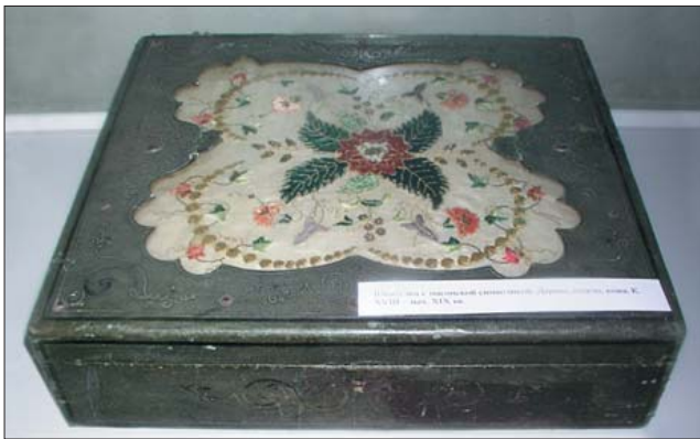
Шкатулка с масонской символикой (конец XVIII — начало XIX в.).

2. Памятники гражданского быта и общественной жизни. Среди них насчитывалось около 1500 серебряных и медных монет разного достоинства, гражданские ордена, охотничьи принадлежности, образцы кафеля и изразцов. Широко представлены настенные и памятные медали польские, французские, итальянские, шведские, еврейские, выполненные из серебра, бронзы, меди, свинца, чугуна, алюминия (около 300 наименований за период с XVIII в. по начало XX в.). Среди них настенные медали “Ядвига”, королева польская 1384—1399 гг., “Казимир IV Ягеллончик”, король польский 1447—1492 гг., с 1440 г. — великий князь Великого княжества Литовского, “Стефан Баторий”, государственный деятель, полководец, великий