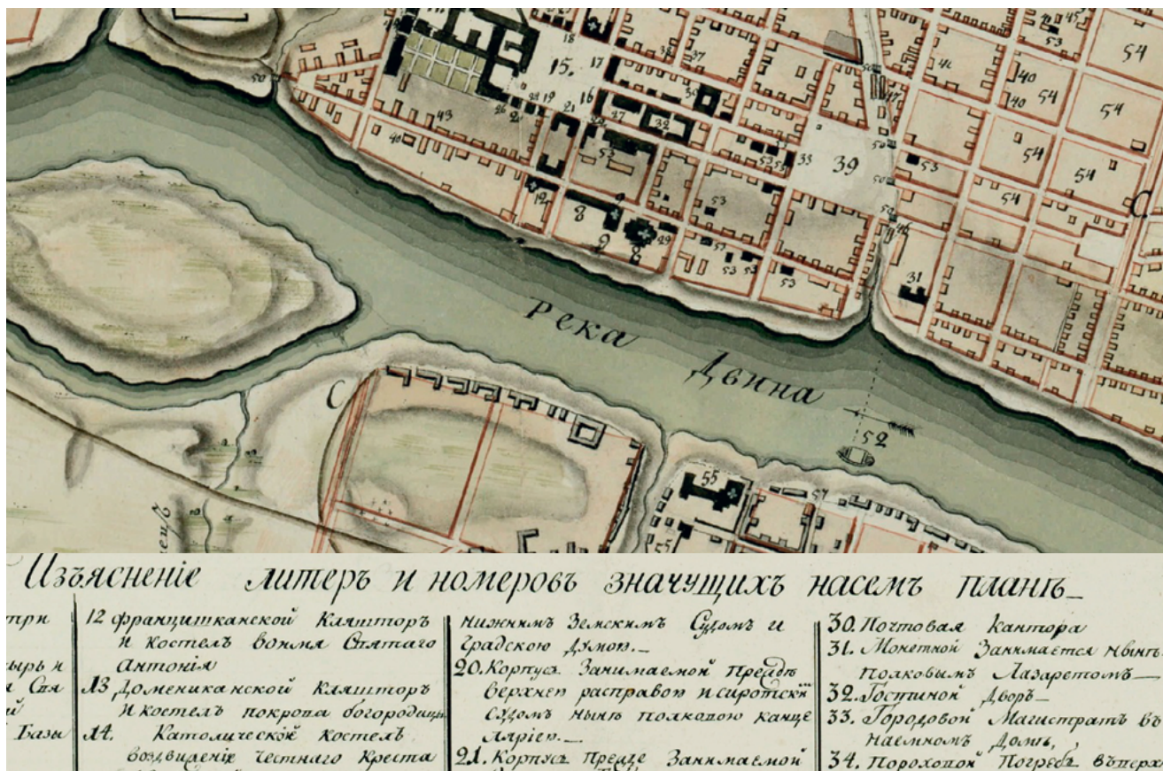
Фрагменты «Геометрического Плана» и «Изъяснения» к нему с указанием на здание бывшего монетного двора