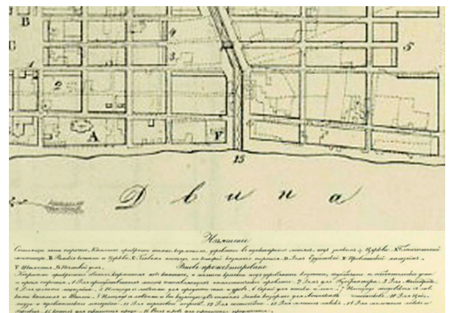
Фрагмент плана 1778 г. с обозначением местонахождения таможен и «изъяснение» к плану

Вторая карта озаглавлена «Геометрической Планъ Витебской Губерніи Гораду Полоцка. С показанием публичныхъ каменныхъ и деревянныхъ строений значущихъ попроекту и въ старом виде находящихся» (рисунок 3). Карта не датирована, но можно полагать, что она составлена не ранее марта 1802 г., когда была образована Витебская губерния, и не позднее 1812 г. Под номером 31 на плане значится здание под названием «Монетной», в легенде дано пояснение: «Занима-