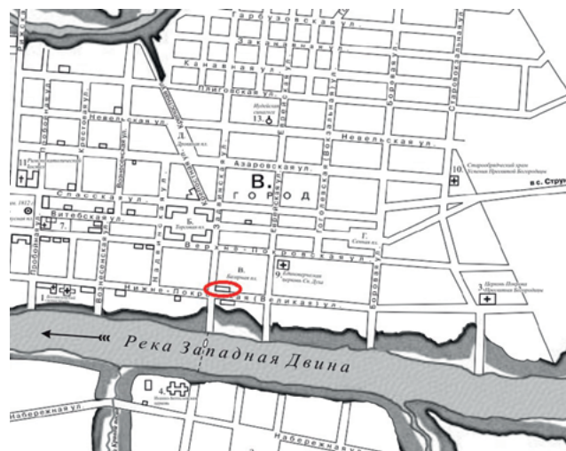
Фрагмент плана Полоцка из путеводителя 1910 г. [7] с обозначением здания, предположительно построенного на месте здания бывшего монетного двора

Так завершилась история Полоцкого монетного двора. Но кто знает, возможно, в истории монетного дела на территории Беларуси это еще не окончательная точка?