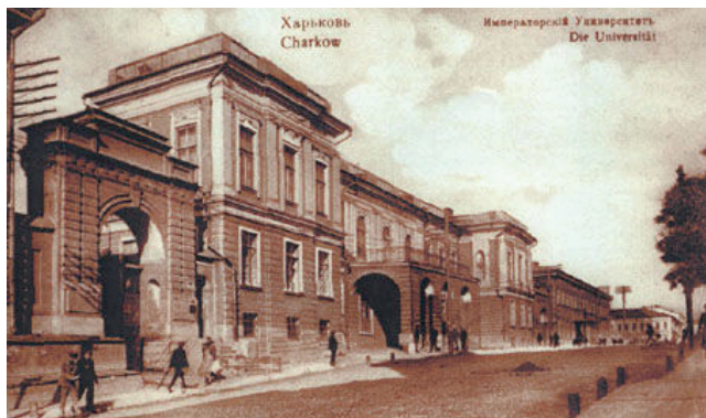
Імператарскі Харкаўскі ўніверсітэт (1805–1917)

дра І. Рэформа прадугледжвала стварэнне шасці вучэбных акруг, цэнтрамі якіх з'яўляліся імператарскія ўніверсітэты з удзікам таго, што ў трох з іх установы ўжо існавалі (Маскоўскі, Віленскі, Дэрптскі), у адрозненне ад Харкава, Казані і Санкт-Пецярбурга. Згодна са Статутам, падпарадкоўваліся ўніверсітэты Міністэрству народнай асветы [5, с. 215–290]. Кіраваліся Праўленнем, у склад якога ўваходзіў рэктар – старшыня Праўлення, дэканы факультэтаў – члены Праўлення, а таксама «непременный заседатель» 2 [5, с. 267–268].