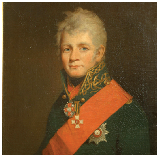
Павел Васільевіч Чычагаў (1767–1849)

Харкаўскі ўніверсітэт быў заснаваны ў 1805 г. першым папярэднікам Харкаўскай вучэбнай акругі С.І. Патоцкім падчас адукацыйнай рэформы Аляксан-