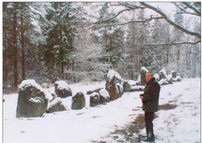
У ладвиевидного могильника. Остров Готланд, Швеция. 2004 г.