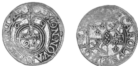
Карл XI, Ливония

нии последний выпуск шведских солидов сделал в 1665 г., полтораков – в 1669 г. Последние выпуски солидов рижского монетного двора также датированы 1665 г., полтораков – 1669 г. (рисунок 4). После этого ливонский монетный двор работу прекратил, а в работе рижского наступил длительный перерыв. Работа рижского монетного двора ненадолго была возобновлена при Карле XII, в начале 1700-х гг. была начата чеканка дукатов и полтораков [11]. Полто-