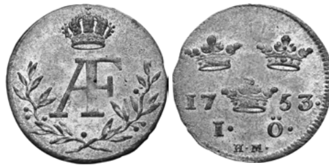
Адольф Фредрик (1751–1771)

Тип биллонных монет номиналом 1 эре, установленный в 1665 г. Рисунок 1