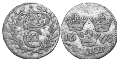
Карл XI (1660–1697)

Для понимания механизмов появления шведского биллона в истории денежного обращения начала XVIII в. необходимо заглянуть чуть глубже в историю. Первые монеты шведского чекана, находки