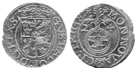
Густав Адольф (Рига)