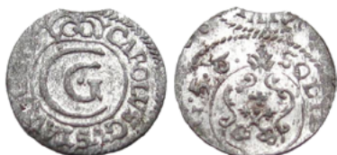
Карл X Густав