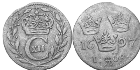
Карл XII (1697–1718)