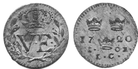
Ульрика Элеонора (1718–1720)