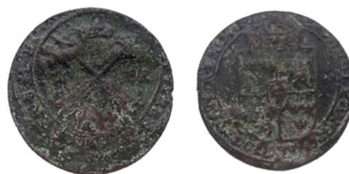
Медный зре времен правления Густава-Адольфа (1594–1632), найденный в Узденском районе Минской области

Очевидно, что для проведения крупных внешнеторговых операций требовалась монета крупных номиналов. На монетных дворах захваченных территорий периодически чеканились талеры, полталеры, золотые дукаты и даже кратные дукату монеты. Но тиражи этих выпусков были незначительны, сами монеты на сегодняшний день являются нумизматической редкостью. Роль торговой монеты играли, главным образом, отчеканенные в Нидерландах талеры и их фракции, а также золотые дукаты. Разменной монетой служили гроши и трояки чеканки г. Эльблонга, но в большей степени битые огромными тиражами полтораки и солиды эльблонгского монетного двора и особенно двух рижских. Говоря о мелких номиналах, следует отметить еще один любопытный факт: медные шведские монеты, отчеканенные для внутрисударственного обращения и попадавшие в значительных количествах на завоеванные территории, о чем свидетельствуют многочисленные найденные там клады [15], на территории Беларуси отмечаются лишь редкими единичными находками (рисунок 3). Мнение о том, что их роль в денежном обращении XVII в. на наших территориях недооценена [19], не находит своего подтверждения ни в статистике находок, ни в письменных источниках.