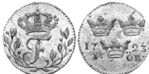
Фредрик I (1720–1751)