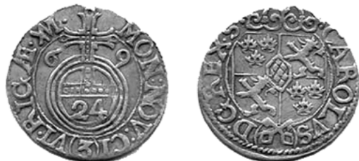
Карл XI, Рига