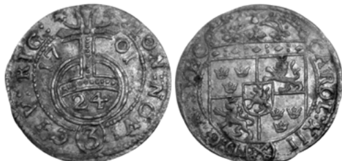
Карл XII, Рига

Шведские полтораки времен правления Карла XI и Карла XII, отчеканенные в Прибалтике